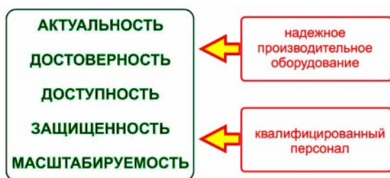
Рис. 3. Требования к ресурсному обеспечению единого информационного пространства ОУ

возникающие информационные потребности (рис. 3).